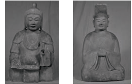
箱根神社女神坐像(左)と男神坐像(右)

4月20日に開催された文化審議会において、箱根神社所蔵の神像(男神坐像、女神坐像各1)を国重要文化財に指定するよう、答申がなされました。 この神像は同じ作者の手による、一対で製作されたものと考えられています。 作風などから11世紀(平安時代)にまでさかのぼるもので、関東地方に伝わる神像の中では最も古い作品として貴重なものです。 この指定により、町の国重要文化財(美術工芸品)は10件となりました。