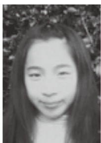
2000 (平成12) 年生まれ

私は今年、小学6年生になります。6年生になることは、小学生で一番上になるので、しっかりとしたいです。でも心配もありです。新しい1年生も来るので、面倒を見たり世話をしなくてははいけません。