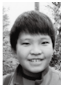
2000 (平成12) 年生まれ

僕は今年、中学生になります。中学生になることはすごく楽しみです。不安もいくつかありますが、他の学校の人も来るので、仲良くできるか心配だし、部活や勉強も忙しくなるので不安です。