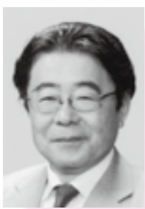
1952 (昭和27) 年生まれ

新年あけましておめでとうございませう。今年で私は5回目の年男になりました。おかげさまで家族に、先輩に、そして友人に恵まれ、日々を平