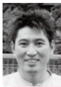
1976 (昭和51) 年生まれ

時は江戸時代、私の先祖は箱根所辺りで旅籠をしていたそうです。先人の開拓があり、現在の箱根がある。