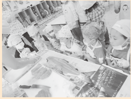
★食育教室(米、魚)「鮭が切り身になった!」