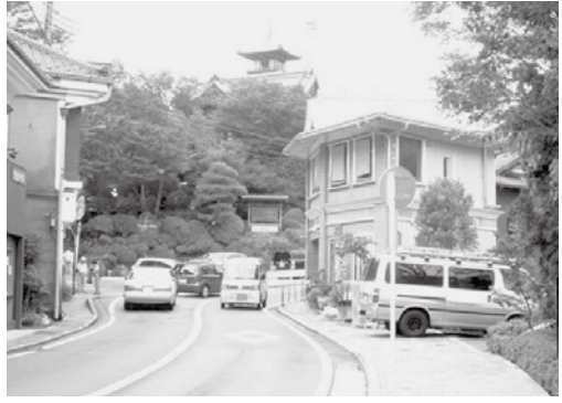
宮ノ下国道1号線からホテルの塔屋を望む

そうなんです。なんかないいよねです。なんでしょう……自然、歴史、建物、それぞれの地域の雰囲気、一番いいのは、住んでいる皆さんの心です。 それらはすべて先人達が残してくれた偉大な遺産でもあります。 私の好きな景色、景観は町の中にたくさんあります。 湯本の温泉場の雰囲気、大平台の路地、宮ノ下独特のちよつとエキゾチックな街並み、宮城野の川沿いの桜、仙石原の湿原、箱根の富士山と芦ノ湖……明治