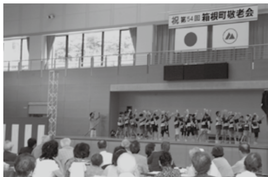
老人福祉事業功労者（敬称略）

なお、演芸会に先立ち行われた式典では、町の老人福祉向上などに功績があった5人の方々に、町長から感謝状と記念品が贈られました。