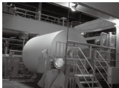
乾燥工程を終了して巻取る