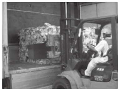
運びやすいように四角に圧縮した「その他紙」が製紙工場に到着