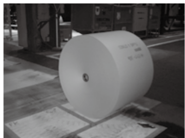
再生紙のロールとしてカットされ完成

「その他紙」は、製紙工場の機械に投入後、約1時間で段ボールの中芯（段ボールの内側のギザギザの部分）などに使用される再生紙になります。