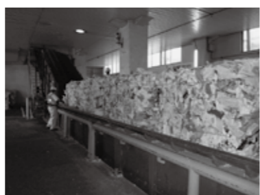
紙の原料に戻す機械に投入