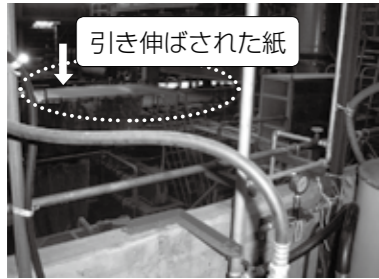
引き伸ばされた紙 (異物が除去され水分を含んだ状態の紙)