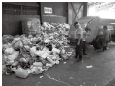
町内の集積場所から集めたものを小田原市の中間処理業者へ搬入