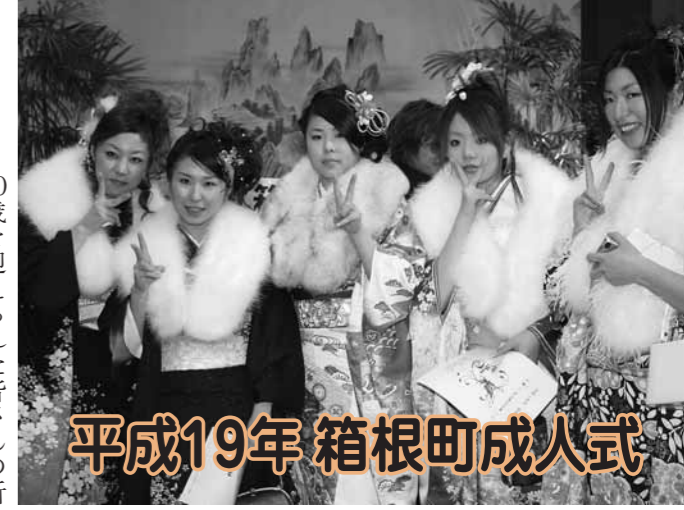
平成19年箱根町成人式