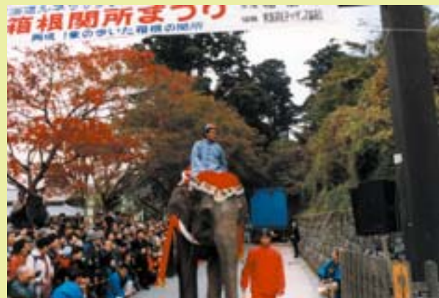
箱根関所まつり (平9)