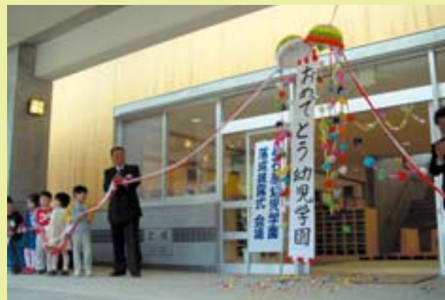
仙石原幼児学園開園 (平15)