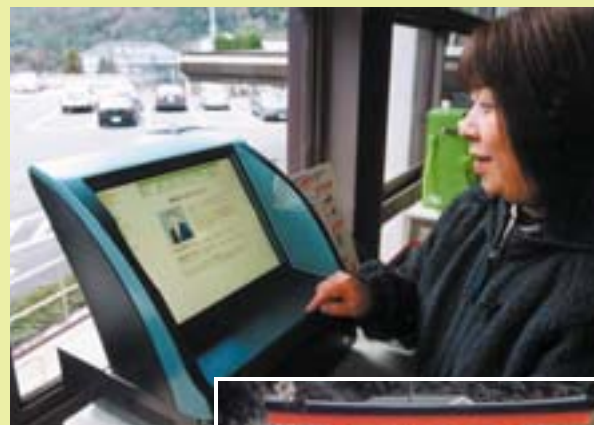
行政ホームページ開設 (平13)