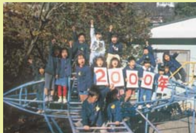
20世紀が終わりを告げました (平12)