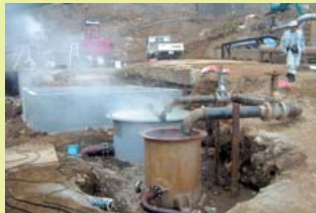
台風により町営温泉施設などに甚大な被害 (平17)