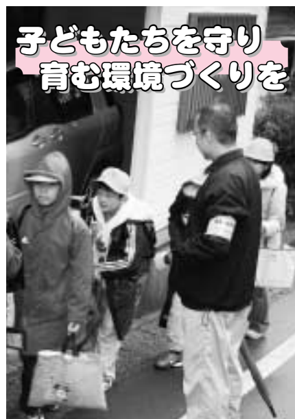
温泉地区では有志の方が「地域見回りパトロール」を実施し児童の登下校などを見守る活動を行っています。