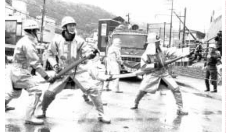
熱のこもった訓練の様子

近年、災害は多種・多様化しており、我々消防団員も日々訓練を重ね、技術と知識の向上を図り、団員一丸となって災害から地域を守っていききたい。