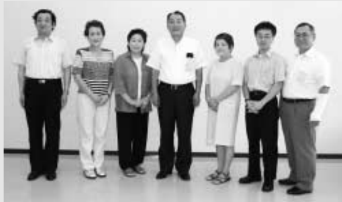
照会先 企画課 ☎5 - 9560