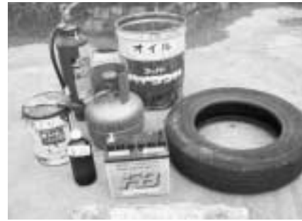
収集できない主なごみ

なお、接続工事に要した費用について、供用開始の告示の日から3年以内の地域の方には、補助または貸し付けを行っています。