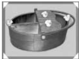
作品名「小鳥の楽園」