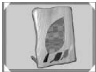
作品名「森からのおくりもの」