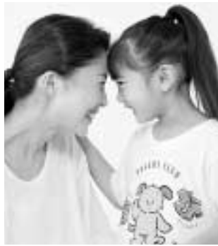
照会先 教育委員会学校教育課 ☎5・7600

子育て中の家庭が抱える育児不安等についての相談や、未就園児の遊び場の提供を行います。 開設場所 湯本小学校 開設日 月曜日・金曜日（国民の祝日を除く） 開設時間 10時～14時 幼児等一時預かり 保護者の病気やケガなどで一時的に保育が必要となるお子さんをお預かりします。 開設場所 湯本小学校 開設日 月曜日・金曜日（国民の祝日を除く） 開設時間 10時～14時 利用できる幼児など 町内に在住している2歳～小学校3年生 利用定員 1日6人 利用者負担金 1時間300円