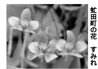
虻田町の花 すみれ