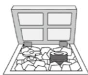
発泡スチロールや新聞紙をつめてください

真冬日などは次のような対策をし、凍結防止に努めましょう。 ・水道は蛇口を少し開け、水を少し出しておく ・メーターボックスに砕いた発泡スチロールなどを詰める