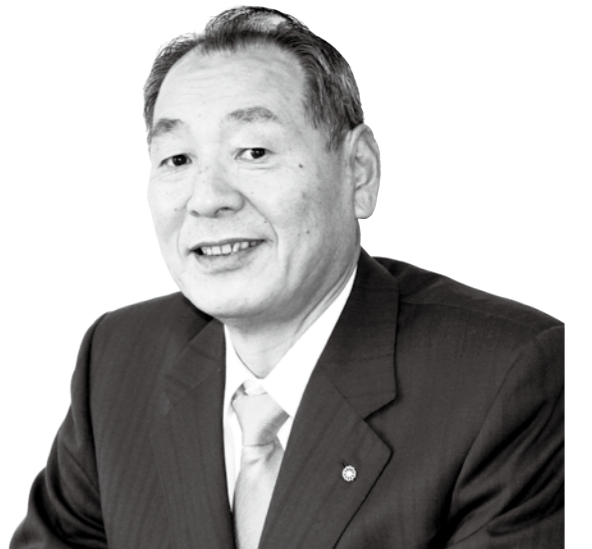
箱根町長 山口昇士

さて、町議会では、議会運営における最高規範である箱根町議会基本条例の下、「町民から最も頼りにされる議会」を基本理念に据え、議会改革を推し進めております。昨年は、町民と議会を結ぶ窓口として広報広聴委員会を設置し、見えにくい、分