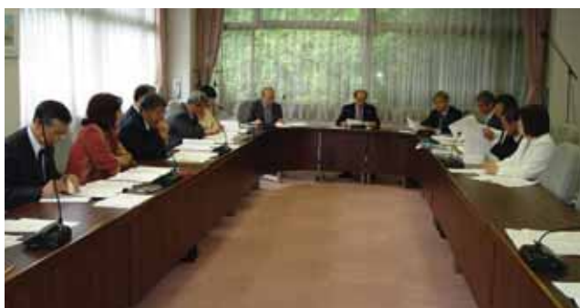
箱根町議会基本条例調査特別委員会