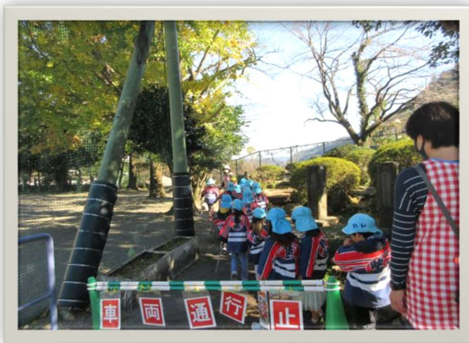
【 幼年消防クラブ 法被通園 】