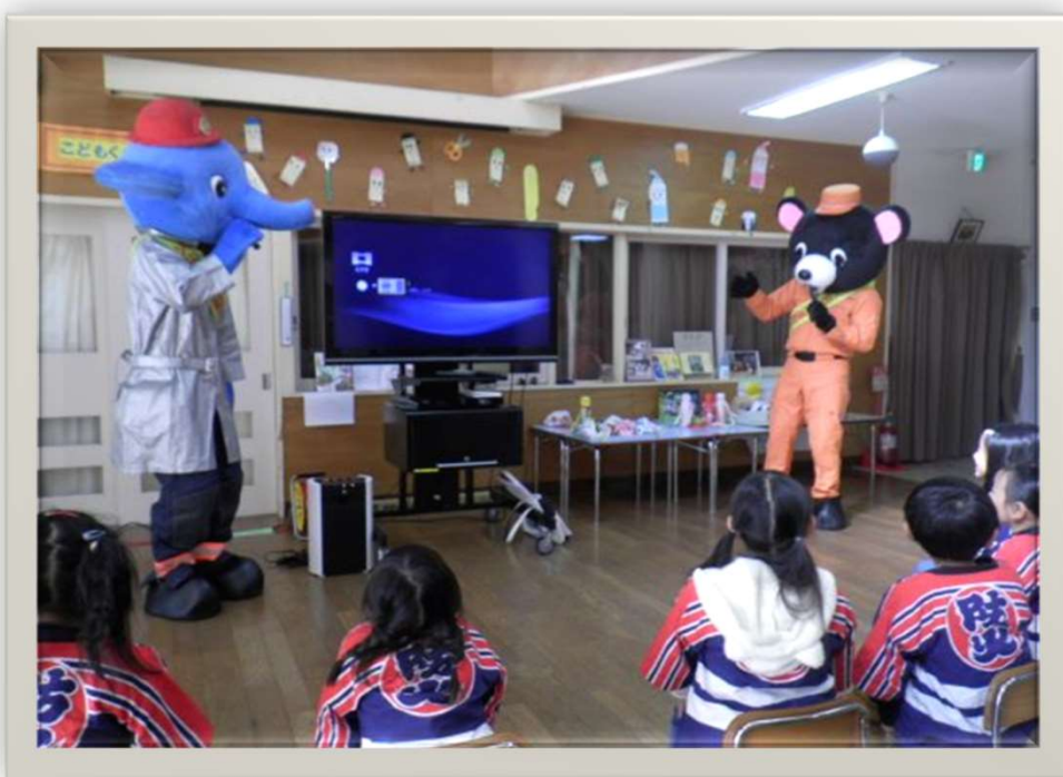
【 ポンプ君とレスキュー君の防火広報 】