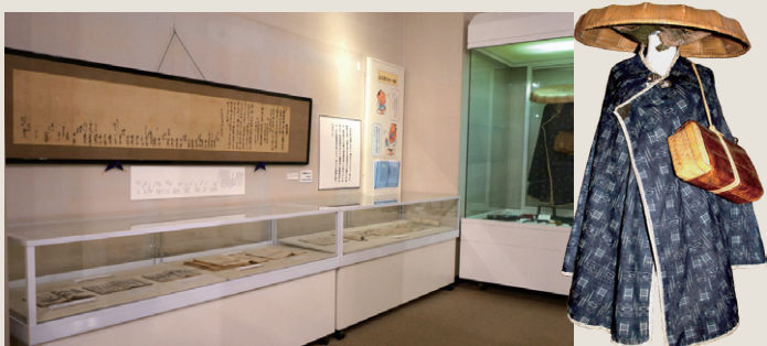
江戸時代の旅道具

江戸時代の17世紀後半、箱根には既に「箱根七湯」と呼ばれる7つの温泉場がありました。元々は病気の療養に使われていた温泉も、次第に絶景や名所を訪ね、温泉を楽しむ旅へと変わります。こうした風潮に合わせるかのように、箱根は温泉観光地へと歩みはじめます。