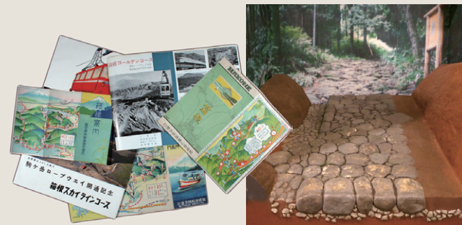
戦後発行のパンフレット類

また、今では観光の魅力となっている、箱根に残る様々な文化財についても紹介しています。