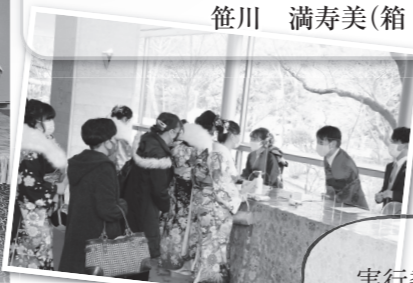
実行委員とアドバイザー