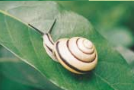
仙石原のハコネマイマイ