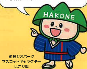
箱根ジオパーク マスコットキャラクター はこじ郎

ジオサイトでは、雄大で美しい景色を見るだけでなく、大地の成り立ちやそこに住む生き物、そして人の暮らしや歴史・文化のかけわりを楽しく学ぶことができますよ