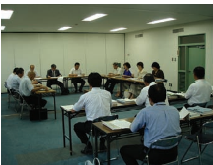
箱根町自治基本条例審査特別委員会

付託となった「箱根町自治基本条例の制定について」を審議し、報告書を議長に提出しました。