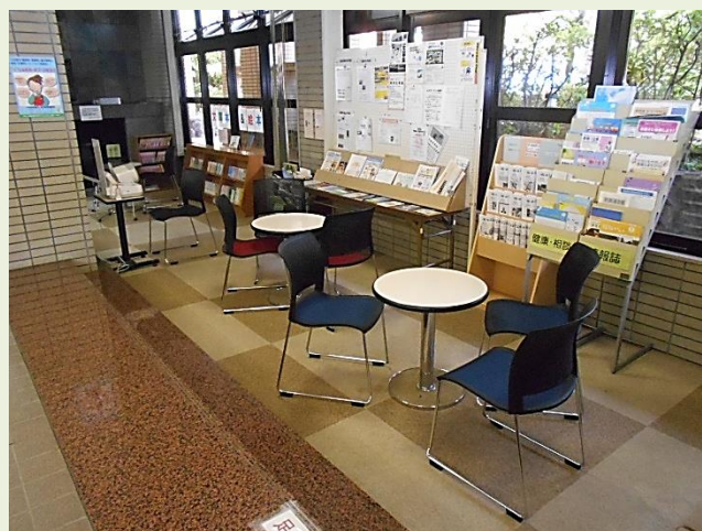
▲1階ギャラリー 談話コーナー

また、地階図書室と2階調理室の空調設備（冷暖房式エアコン）の更新工事を行いました。人々の交流の場である社会教育センターにぜひお越しください。