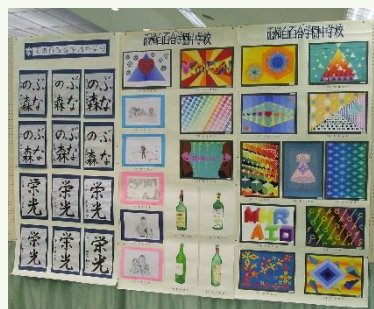
園児・小中学生作品