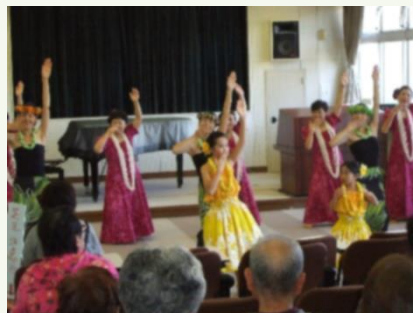
フラ アオ ラニ のみなさん