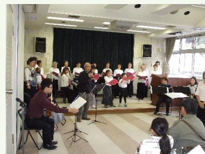
コールフレンド・フルートアンサンブルはこねの皆さんの演奏