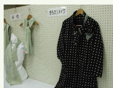
着物のリメイクなど手芸作品