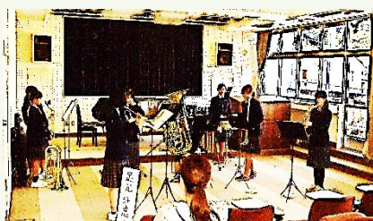
箱根中学校吹奏楽部による演奏