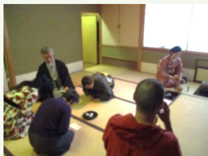
お茶席でひとやすみ