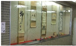
ショーケースに茶道具を 展示しました

3月29日(木)13時から、社会教育センターギャラリーで、定期利用団体「宗崑会」による、茶道の体験教室を開催しました。気軽に茶道に親しめるように、立礼式で開催し、参加者は「宗崑会」会員がたてた抹茶をいただきました。呈茶の後は、会員の説明を聞きながら、茶道具の鑑賞体験をしました。当日は社会教育センターでも桜が咲き始めており、まさに「春」を感じた体験教室となりました。