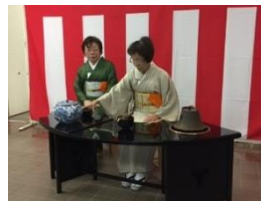
いすに座ってお茶を たてます