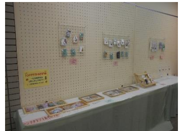
< 作品展示 1 階 >