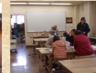
〈子 ど も 体 験〉