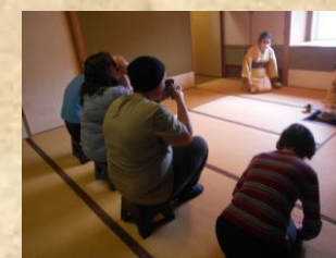
〈お 茶 席〉