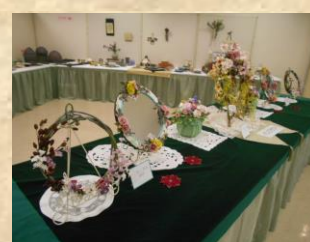
〈カ ト レ ア 会〉