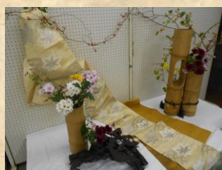
〈生 け 花〉

また、今年は新たに「アーティストコーナー」を設け、箱根の芸術家の作品を展示し、好評をいただきました。