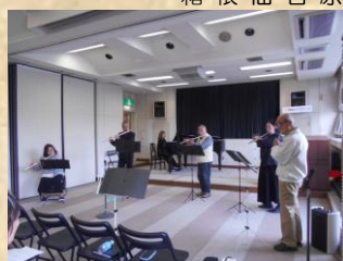
〈フ ル ー ト アン サ ン プ ル は こ ね〉