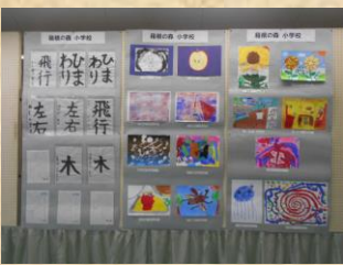
〈園 児・学 生 作 品〉