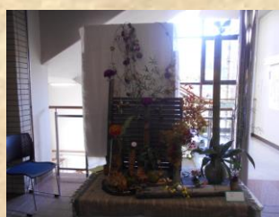
〈ア ー テ ィ ス ト コ ー ナ ー〉