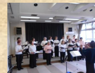
〈コ ー ル フ レ ン ド〉