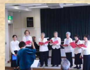
〈コ ー ル ブ ラ イ ト〉