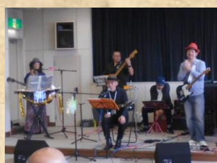
〈バ ン ド 演 奏〉