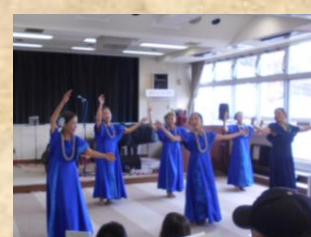
〈フ ラ ア オ ラ ニ〉