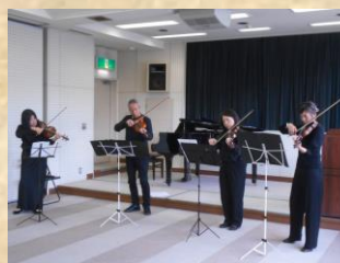
〈は こ ね の 音〉