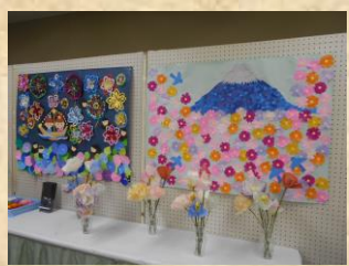
〈ア レ ン ジ メ ン ト ケ ア 箱 根 仙 石 原〉