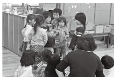
3歳児部会・公開保育 10/27 仙石原幼児学園

子どもたちの感性をゆさぶり、心を耕すハートフルプログラムの研究に取り組んで3年目、今年度は、年齢別の研究を充実させて進めています。