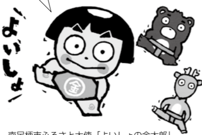
南足柄市ふるさと大使「よいしょの金太郎」

「大雄山最乗寺」へは、伊豆箱根鉄道大雄山線「大雄山駅」から伊豆箱根バスで道了尊行10分「道了尊」バス停下車