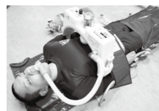
車内に搭載されている自動心肺蘇生器