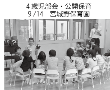
4歳児部会・公開保育 9/14 宮城野保育園