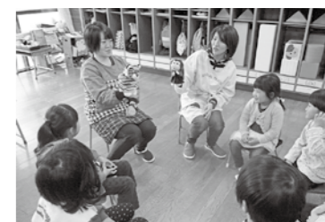
5歳児部会・公開保育 11/17 箱根幼稚園