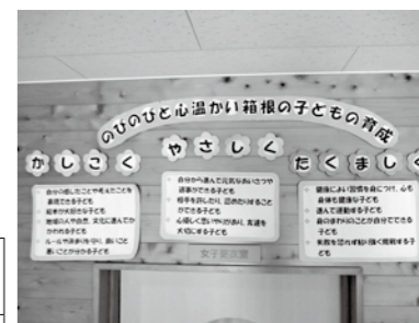
湯本幼児学園の教育目標