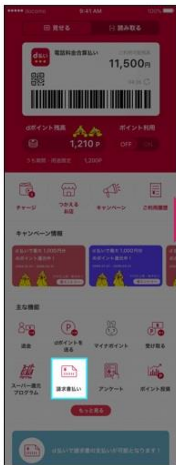
①ホーム画面から「請求書払い」をタップ