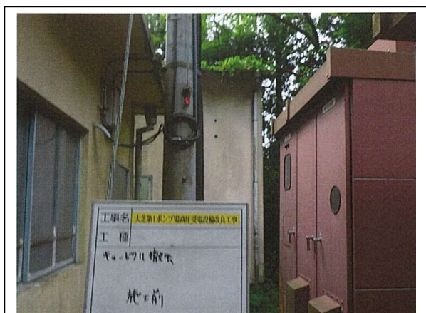
受変電設備 更新前