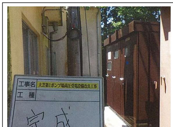
受変電設備 更新完成