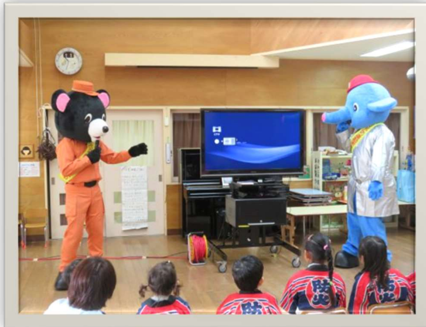
ポンプ君とレスキュー君の防火広報