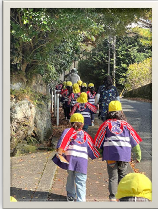
幼年消防クラブ 法被通園