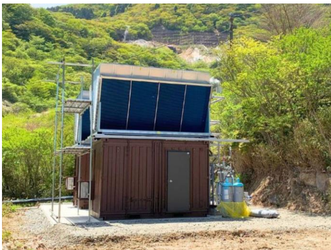
箱根湯の花プリンスホテル バイナリー発電施設

加熱源により、沸点の低い媒体を加熱・蒸発させてその蒸気でタービンを回す方式です。加熱源系統と媒体系統の二つの熱サイクルを利用して発電することから、バイナリーサイクル（Binary-Cycle）発電と呼ばれており、地熱発電などで利用されています。