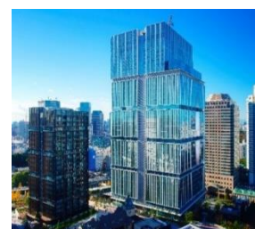
東京ガーデンテラス紀尾井町