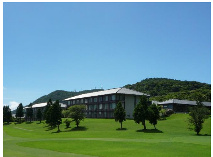
箱根湯の花プリンスホテル 外観